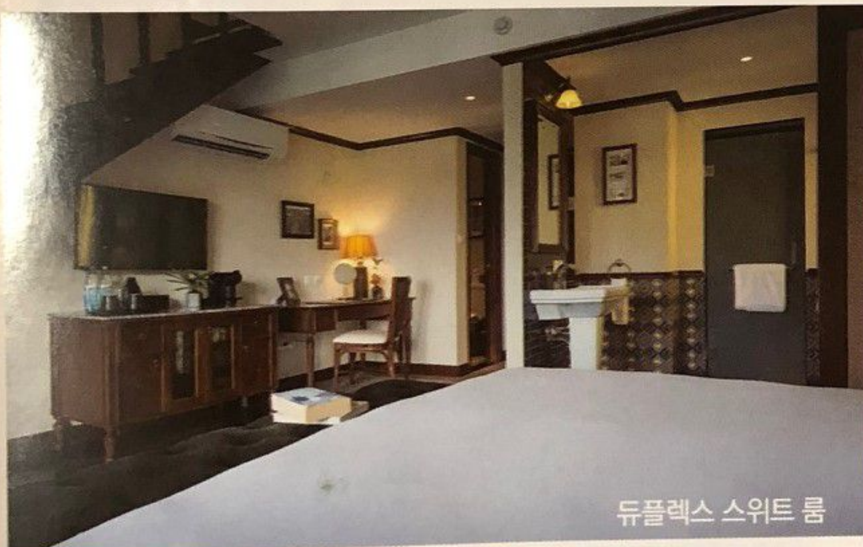
듀플렉스 스위트 룸

로 나누어져 있는데 특히 스위트와 빌라형식의 객실로만 구성된 신관의 경우 15세기의 탕하(Thanh Ha) 도자기마을의 모습을 콘셉트로 외관이 구성되어 있다. 구관의 일반실의 경우에도 충분히 매력적인 가격과 서비스를 그리고 뷰를 제공하지만 특히 신관의 객실의 경우 웬만한 5성 호텔이나 리조트의 스위트 객실이 부럽지 않은 시설과 서비스로 고객을 감동시킨다. 리조트의 객실타입이 총 12개나 되어 다양한 층의 고객들의 니즈를 맞추고 있다. 특히 객실 안에 건식사우나와 마치 일본의 료관에 온 것과 같은 나무욕조를 갖추고 있는 베란다 스위트 풀 뷰 (Veranda Suite Pool View) 객실과 넓직한 테라스에 자쿠지와 태닝 선베드를 갖추고 있는 프리미엄 테라스 스위트 (Premium Terrace Suite) 객실, 그리고 복층으로 구성되어 있어 최대 성인 4인까지 수용이 가능한 듀플렉스 스위트 발코니 (Duplex Suite Balcony) 객실은 다른 럭셔리 부티크 호텔에서는 쉽게 찾아볼 수 없는 넓직한 객실 사이즈와 럭셔리한 시설물(특히 럭셔리한 침구와 욕실)로 고객들의 시선을 사로잡는다. 또한 이 등급의 스위트 객실에서는 객실 내 무료 미니바 사용이 가능하며 하루에 한번씩 리필이 된다. 최상위급인 듀플렉스 스위트 객실을 제외하고는 다른 스위트 객실들의 가격에 큰 차이가 나지 않고 서로 다른 매력들로 어필하고 있기에 어떤 객실은 선택해야할지 선택장애가 올 정도이다. 리조트에서 직접 운영하고 있는 예약사이트에서는 객실타입을 최대 3개까지 선정하여 서로