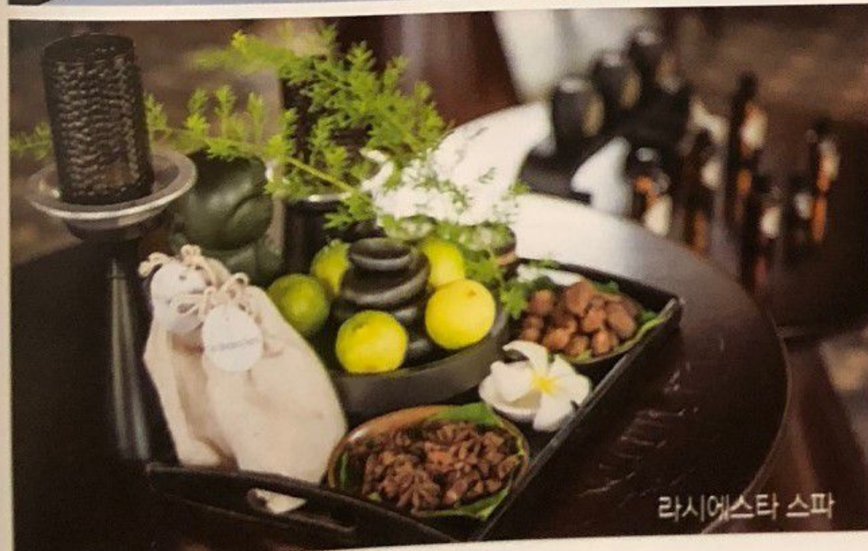
라 시에스타 스파