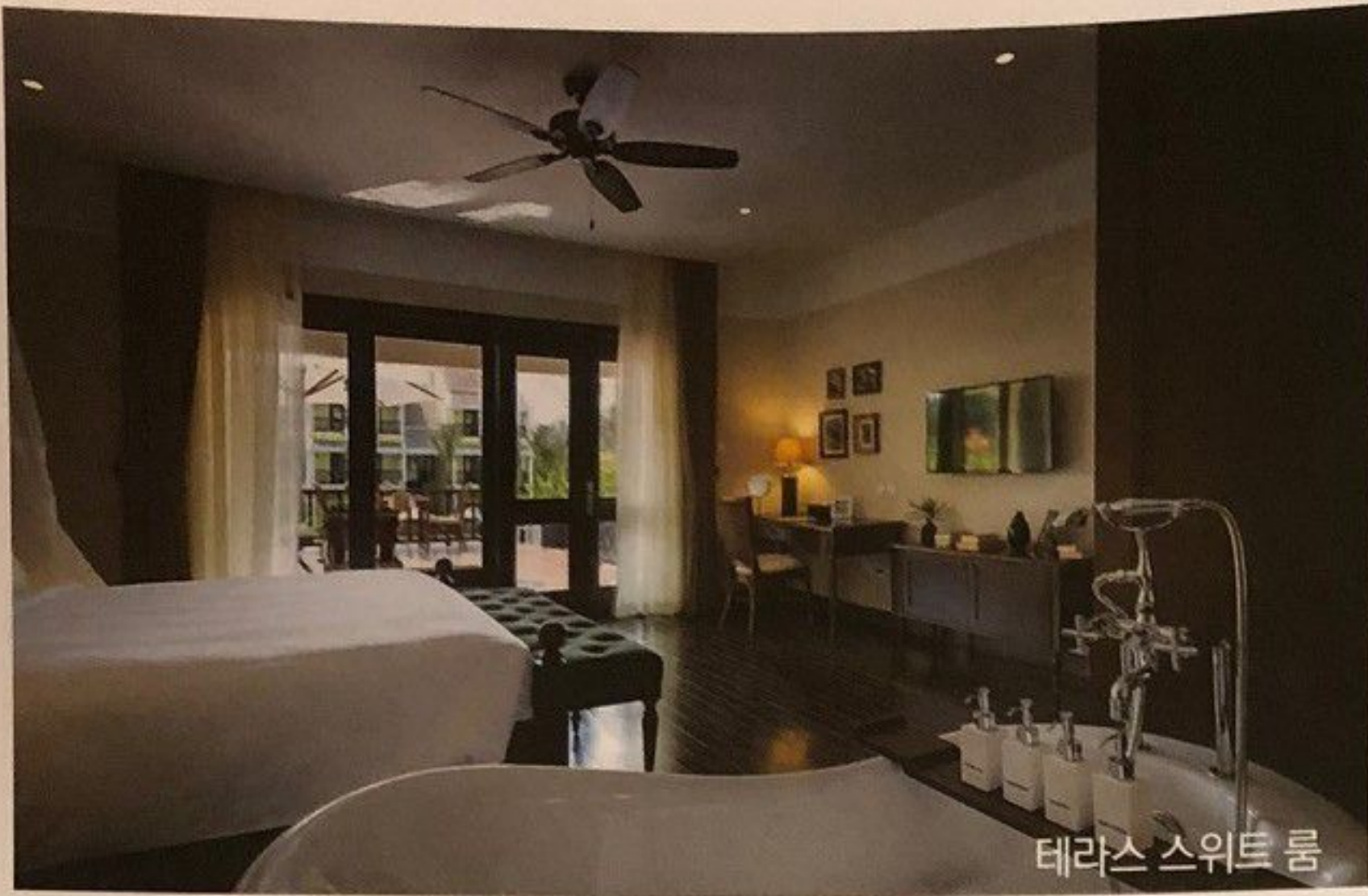
테라스 스위트 룸