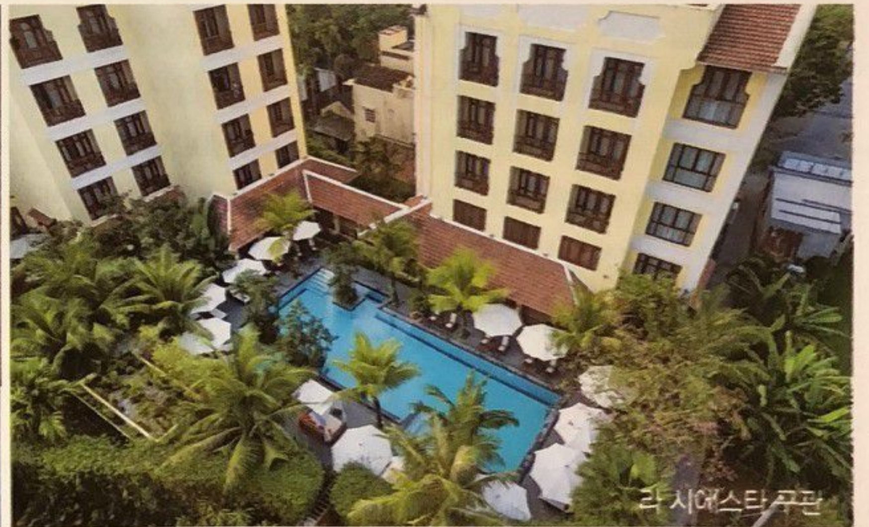
라 시에스타 구관