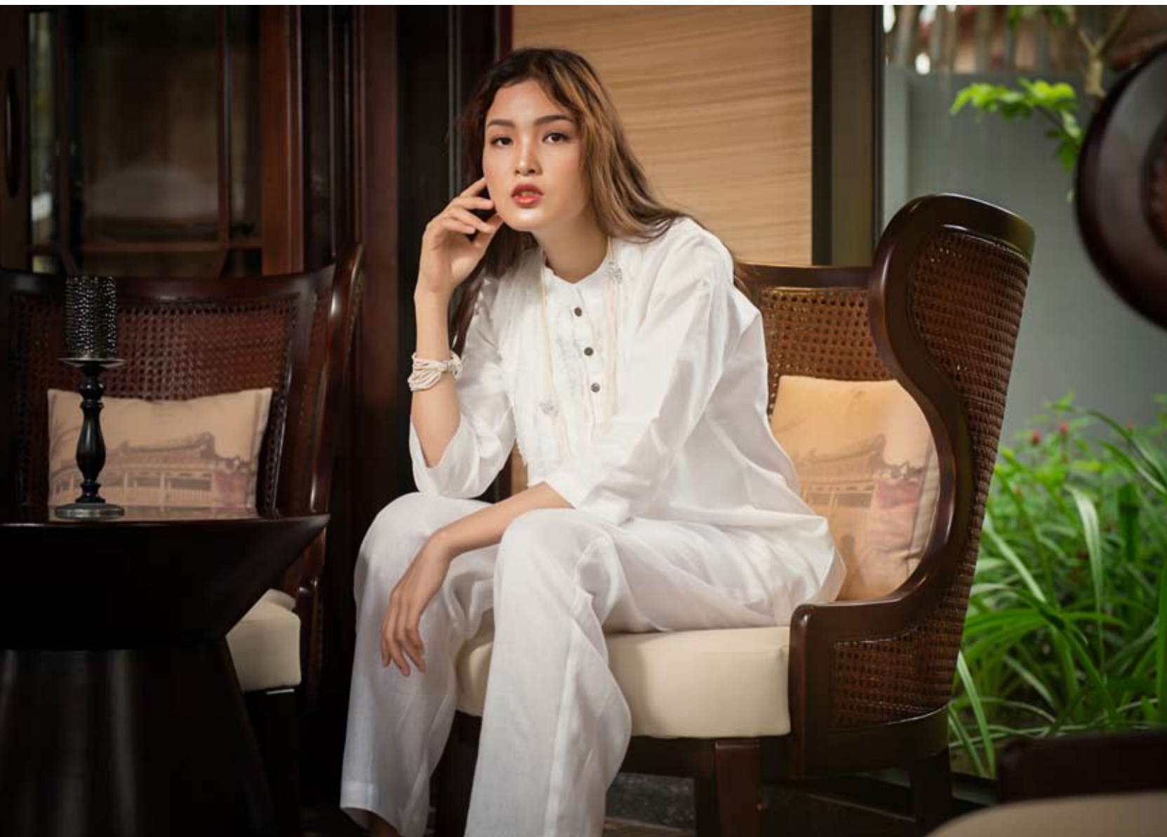
MODEL: Cha Mi - PHOTOGRAPHER: PQ Chua DESIGNER: Kaab - LOCATION: La Siesta Resort & Spa, Hoi An